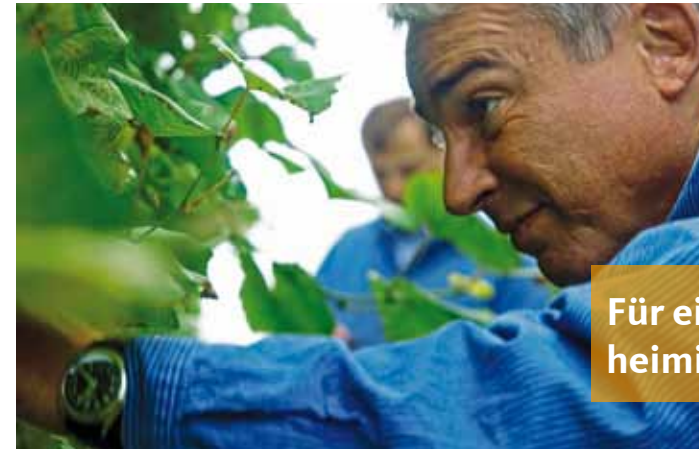
Thomas Strobl bei der Weinlese

setzen wir uns für eine Politik ein, die die Belange aller Generationen berücksichtigt: die der älteren, auf deren Leistung wir heute aufbauen können; die der Familien und der Arbeitnehmer, die unseren Wohlstand erarbeiten; und die der Kinder, die unsere Zukunft sind.