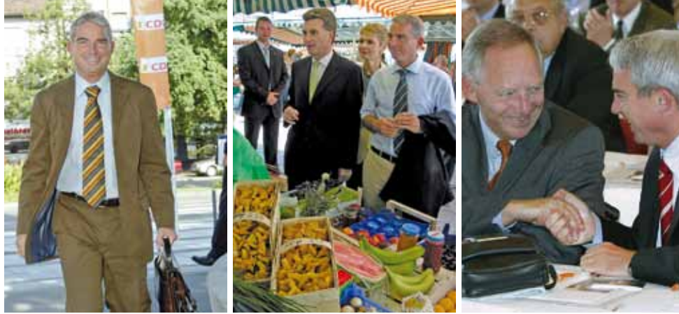
Bundesfamilienministerin Ursula von der Leyen und Thomas Strobl