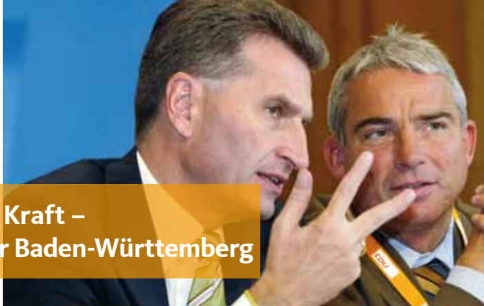
Ministerpräsident Günther H. Oettinger und Thomas Strobl