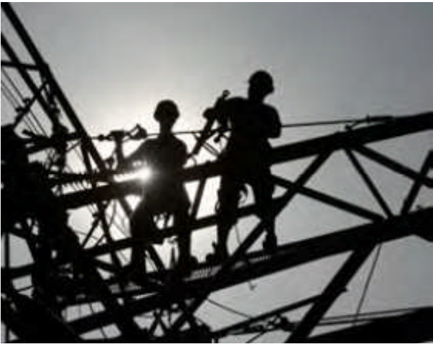
Neue Hochspannungsleitungen für die Energiewende.

Mit dem Ausbau der Elektrizitätsnetze kommt die christlich-liberale Koalition in der Energiewende einen großen Schritt voran. Um den Nordsee-Windstrom in die Regionen im Süden zu transportieren, sind die neuen Hochspannungsleitungen notwendig. Ebenso treibt die Regierung mit einem seit Donnerstag im Bundestag diskutierten Gesetz die weitere praktische Erprobung neuer Technologien an.