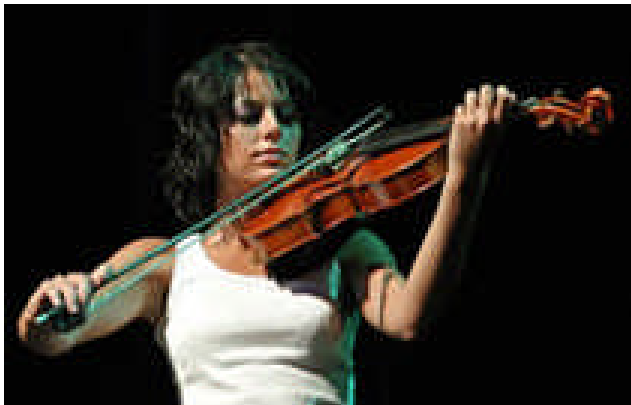
Eine junge Musikerin beim internationalen Musikfestival in Warna, Bulgarien.

Obwohl wir als Europäische Union schon lange eine Gemeinschaft bilden, wissen wir Europäer meist nicht viel über die zeitgenössische Kultur der anderen. Damit die Eurokrise nicht das Einzige ist, das uns verbindet, setzt die Europäische Union das Programm „Kreatives Europa“ auf.