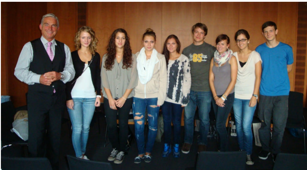
Der direkt gewählte Heilbronner CDU-Abgeordnete Thomas Strobl mit den Abiturientinnen und Abiturienten des Theodor-Heuss-Gymnasiums im Bundestag.

Über Besuch aus dem Wahlkreis freut man sich immer – ganz besonders wenn junge, interessierte Menschen einiges über die Arbeit im Bundestag erfahren möchten. Am Mittwoch empfing der Heilbronner Abgeordnete Thomas Strobl acht Abiturientinnen und Abiturienten des Theodor-Heuss-Gymnasiums Heilbronn. Um eine gemütliche Runde zu bilden, setzten sie sich in einen Stuhlkreis und Herr Strobl begann über seine Arbeit im Bundestag zu berichten. Gespannt und interessiert folgten die Schülerinnen und Schüler seinen Ausführungen und brachten ihre Grundkenntnisse über Politik und die Arbeit im Bundestag ein. Später wurden politische Themen diskutiert, wie zum Beispiel Vermögenssteuer, Arbeitslosigkeit, Wirtschaftslage und Verteilung der Löhne in Deutschland. Da die Jugendlichen den Gemeinschaftskunde-Leistungskurs besuchen und teilweise auch ihr Abitur in diesem Fach ablegen werden, waren sie gut vorbereitet und hatten sich einige Fragen über die politische Arbeit des Abgeordneten überlegt. Nach einer abwechslungsreichen Diskussionsrunde verabschiedeten sie sich freudig und bedankten sich für die detaillierten Einblicke in die Bundespolitik.