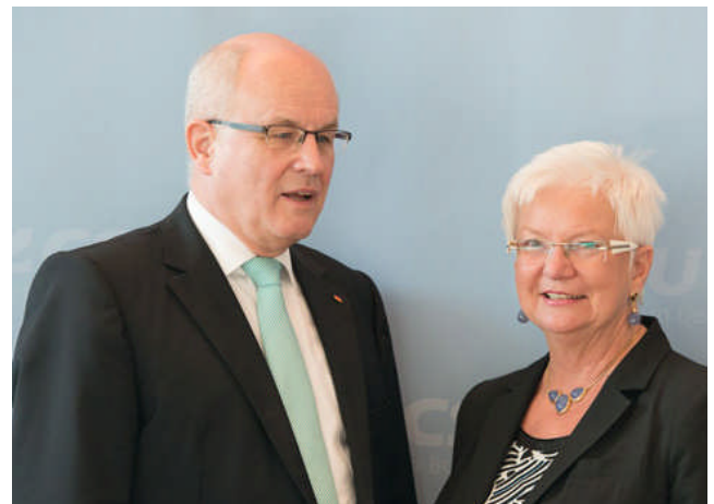
Der Fraktionsvorsitzende Volker Kauder und die Vorsitzende der CSU-Landesgruppe Gerda Hasselfeldt

Die CDU/CSU-Fraktion hat die zweite Jahreshälfte mit einer zweitägigen Klausur des Fraktionsvorstandes, dem auch Thomas Strobl MdB als Landesgruppenchef angehört, eingeleitet.