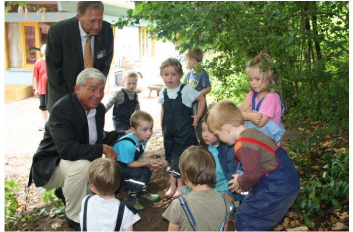
Der Landesvorsitzende Thomas Strobl und sein Abgeordnetenkollege Norbert Barthle hier bei der Besichtigung der Kindertagesstätte der Weleda AG in Schwäbisch Gmünd

politisch in den letzten Jahren diskutiert wurde: "Baden-Württemberg, die Menschen und Unternehmen hier, stehen in besonderer Weise für Pioniergeist, Kreativität und gesellschaftliches Engagement", so Thomas Strobl am Rande der Tour.