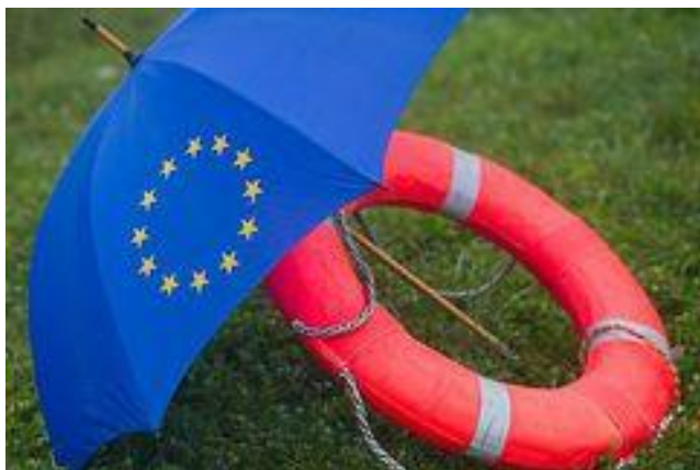
Wir setzen die europäische Einigung, die uns 65 Jahre Frieden und Wohlstand brachte, nicht aufs Spiel.

Thomas Strobl sagte am Rande des Plenums: „Mit dem Europäischen Stabilitätsmechanismus (ESM) sind die Voraussetzungen geschaffen, den Euro langfristig zu stabilisieren, unsere europäischen Nachbarländer durch die schwierigen Zeiten der Reformen und Konsolidierungsbemühungen hinweg zu unterstützen und so drohende Staatspleiten zu verhindern.“