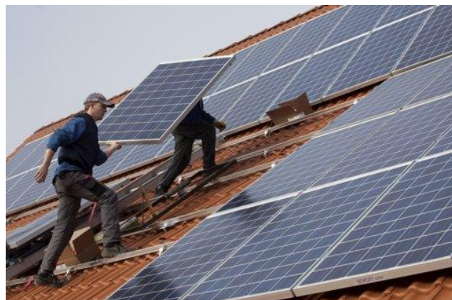
Die Zeiten unsicherer Rechtslage für Investoren sind vorbei (Bildnachweis: dapd).

gruppen zusammengetan, um Schritt für Schritt Lösungen zu finden. Dem nimmermüden Einsatz der Verhandlungsführer und der Kompromissbereitschaft auf beiden Seiten ist es zu verdanken, dass die Sitzung heute recht zügig über die Bühne gebracht werden konnte.“