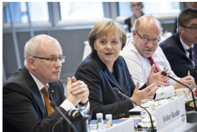
Bis zur Ernennung Peter Altmaiers zum Bundesumweltminister haben Volker Kauder (von links), Angela Merkel und Peter Altmaier gemeinsam erfolgreich die Bundestagsfraktion geführt.

Die Stabilitätspolitik der christlich-liberalen Koalition hat sich bezahlt gemacht: Deutschland steht nach der globalen Wirtschafts- und Finanzkrise deswegen so gut da, weil die Koalition ihren Stabilitätskurs durchgehalten hat. Die Wirtschaftsleistung ist mit einem Wert von knapp über 2,5 Billionen Euro so stark wie noch nie zuvor in der Geschichte Deutschlands. Der Leistung der Koalition ist ebenfalls zu verdanken, dass das Land bereits ab 2014 beste Chancen auf einen ausgeglichenen Haushalt hat; und das bei gleichzeitigem Verzicht auf Steuererhöhungen. Das Beste ist aber, dass der Aufschwung bei den Menschen ankommt: So ist die Arbeitslosigkeit mit knapp drei Millionen auf den niedrigsten Stand seit der Wiedervereinigung gefallen. Auch Löhne und Renten steigen wieder.