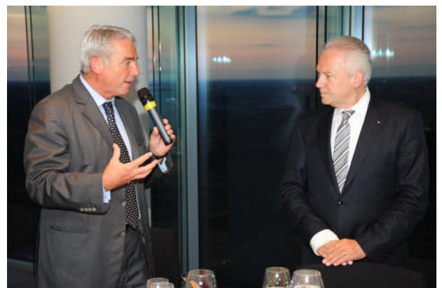
(Landesgruppenchef Strobl verdeutlicht Bahnboss Grube nachdrücklich die Gravamina im baden-württembergischen Schienenverkehr und fordert nachhaltige Verbesserungen)

Am 4. Mai traf sich die CDU-Landesgruppe Baden-Württemberg mit der Spitze der Deutschen Bahn in Berlin. Mehdorn-Nachfolger Rüdiger Grube empfing die von Thomas Strobl angeführten Parlamentarier im Bahn-Tower am Potsdamer Platz.