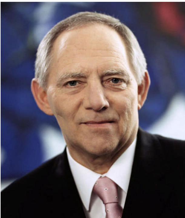
(Plädierte überzeugend für die Griechenland-Hilfe: Finanzminister Wolfgang Schäuble)

Nach Beratungen im federführenden Haushaltsausschuss wurde die Vorlage in zweiter und dritter Lesung an diesem Freitag abschließend im Deutschen Bundestag debattiert.