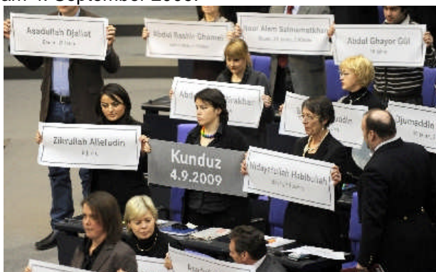
(Agitprop schlimmster Art: Der Auftritt der „Linken“)

Nicht nur Präsident Lammert fühlte sich einen Moment an Weimarer Verhältnisse erinnert. Was sich heute Morgen im Parlament abspielte, gemahnte die meisten Abgeordneten ebenso wie neutrale Betrachter auf den Zuschauertribünen an die unrühmlichen Phasen der jüngeren deutschen Vergangenheit. Wie weiland die extremen Kräfte am rechten und linken Rand in der ersten deutschen Demokratie verhöhnte die Fraktion „Die Linke“ heute früh parlamentarische Gepflogenheiten durch plakativen Aktionismus. Sie entfaltete während der Debatte über Afghanistan Transparente im Plenum und bezichtigte die Bundeswehr des Mordertums für ihre Beteiligung am Bombenangriff auf Kundus am 4. September 2009.