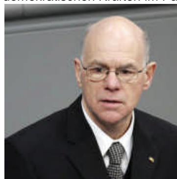
(Reagierte souverän und zeigte der „Linken“ gekonnt die Grenzen auf: Parlamentsoberhaupt Lammert)

Die Reaktion von Präsident Lammert (Sitzungsausschluss der Störer, aber Zulassung zur anschließenden Abstimmung) war denn auch mehr als angemessen und fand breite Unterstützung bei den demokratischen Kräften im Parlament.