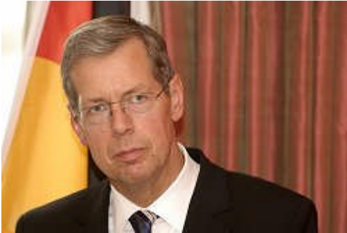
(Wehrbeauftragter seit 2005: Reinhold Robbe)

bericht 2008 befasst sich im Schwerpunkt mit der Ausstattung der Truppe und dem Sanitätsdienst.