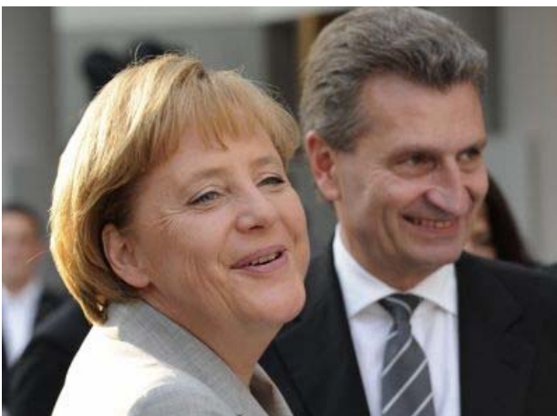
(Kämpfen gemeinsam für einen Sieg im Herbst: Die Kanzlerin und unser Ministerpräsident)

Ich spreche vom geradezu tolldreisten Versuch anonymen Kritiker, unseren erfolgreichen Ministerpräsidenten Günther H. Oettinger gegen die Bundeskanzlerin auszuspielen. Dieser Angriff ist glücklicherweise jämmerlich gescheitert, wie die große Eintracht bewies, die Kanzlerin Merkel und unser Landesvater auf der gestrigen Stallwächterparty in Berlin demonstrierten.